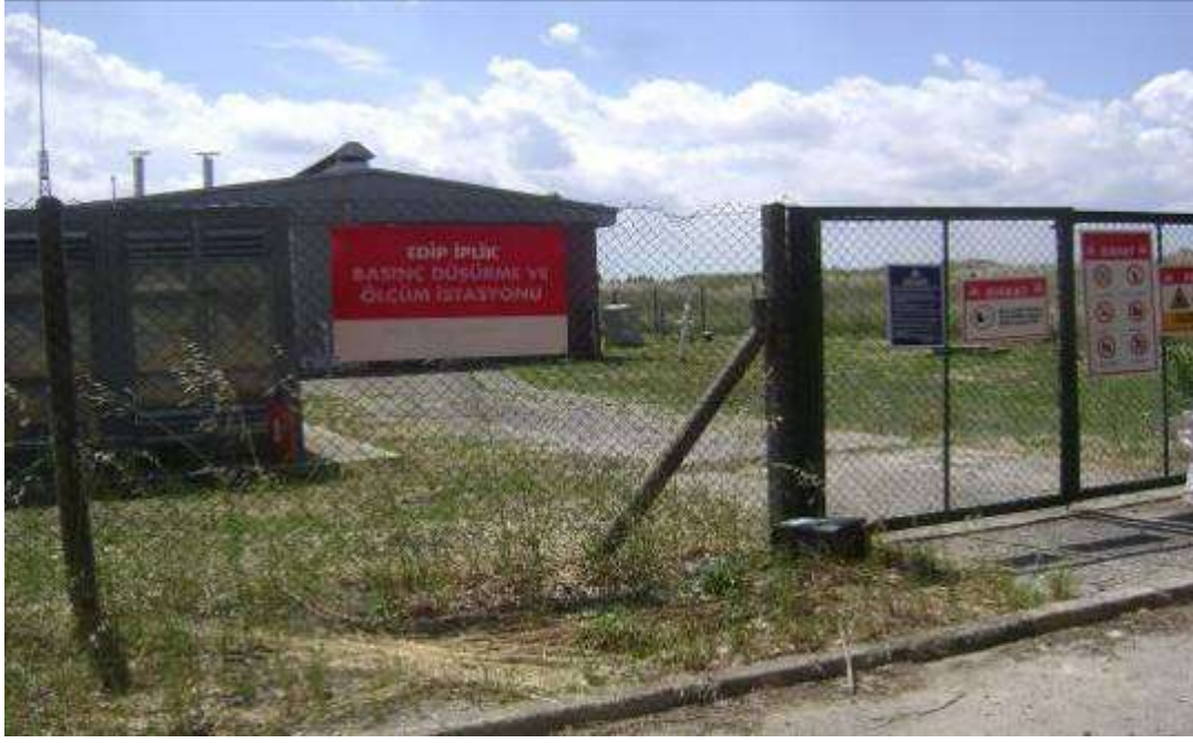
LPG Tesisi ve Doğalgaz basınç düşürme istasyonu