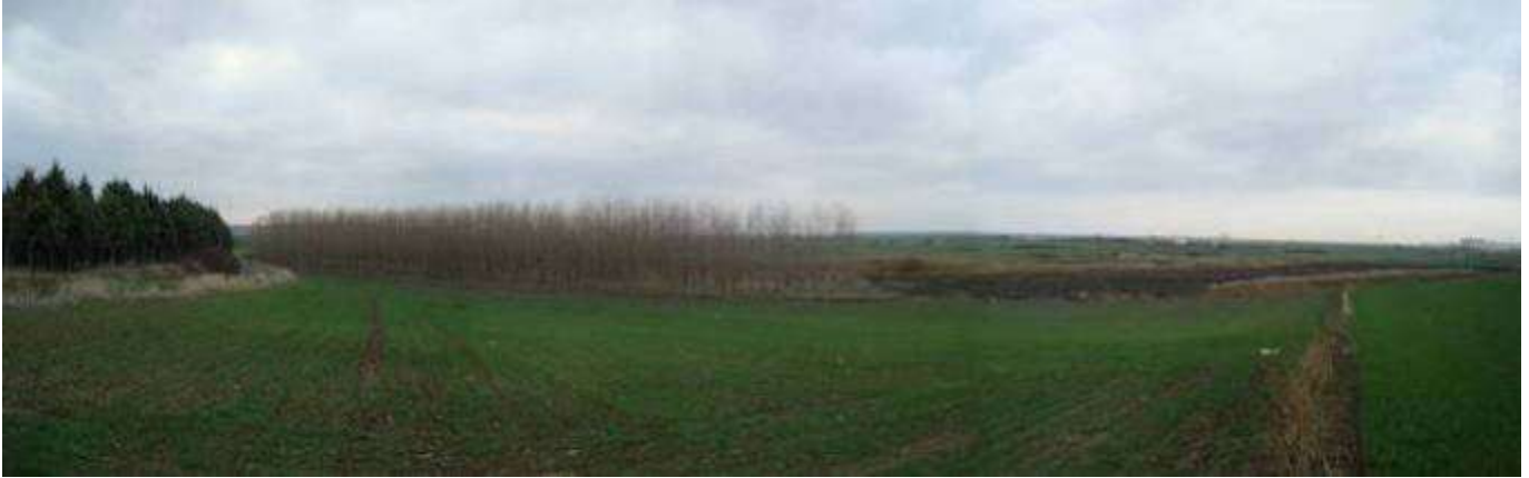
1896 ve 1897 nolu Parsellerin Görünümü