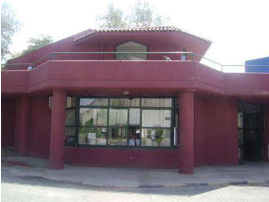
Güvenlik ve Personel giriş Binası