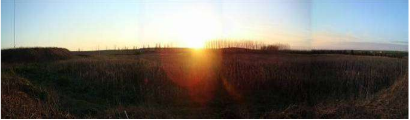
225 ilâ 230 Parsellerin Görünümü