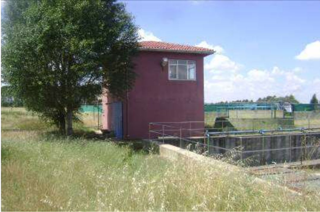
Arıtma Tesisi ve kontrol binası